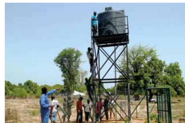
Canalização e Reparação de Bombas de Água