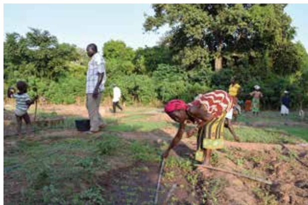
Agricultura e Pecuária