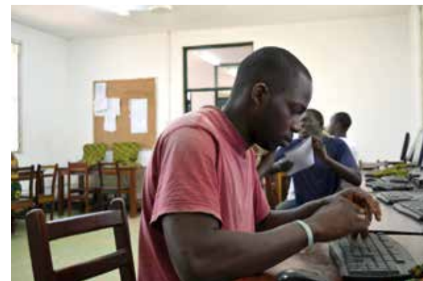
Comércio e Administração de Empresas