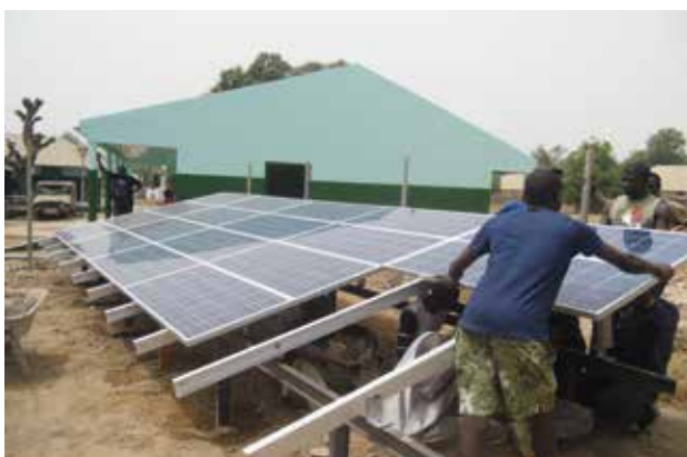
Tecnologia de Energia Solar